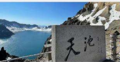
อุทยานฉางไป่ซาน