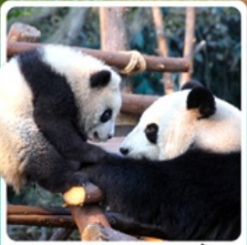
หุบเขาแพนด้าตู่เจียงเอี้ยน