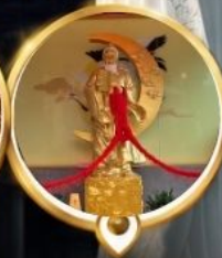
วัดหวังต้าเซียน วอพรความรัก