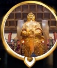
วัดแชกง วอพรโซคลาก