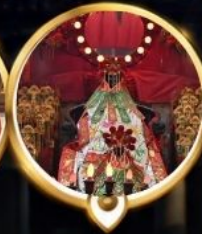
วัดเจ้าแม่กวนอิมฮ่องกง วอพรสุกภาพ