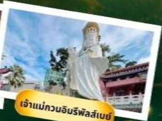
เจ้าแม่กวนอิมรฟัสสึเบย์