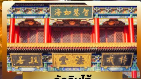
วัดจีนไท้