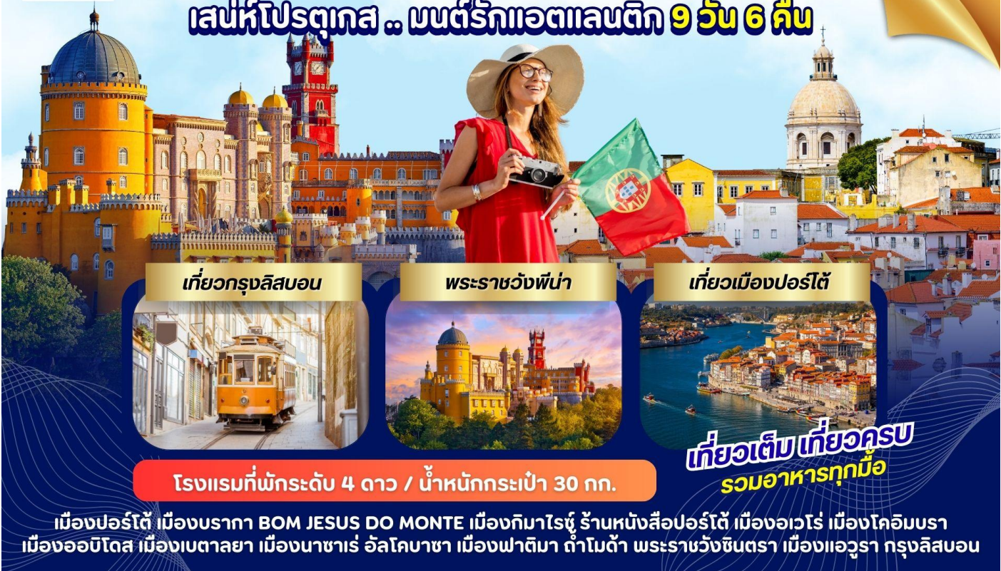
เที่ยวกรุงลิสบอน