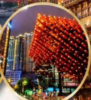
หอศิลป์กั๋วไท่ Guotai Arts Center