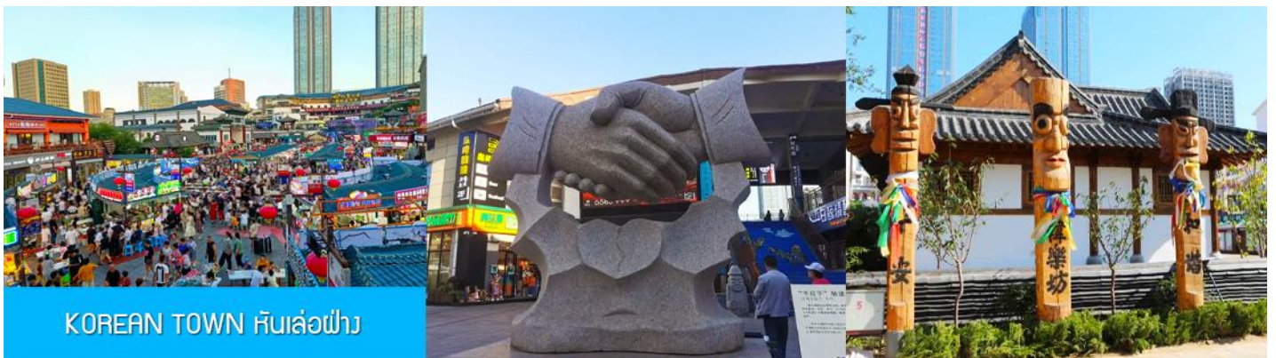
KOREAN TOWN หันล่อฟ้า