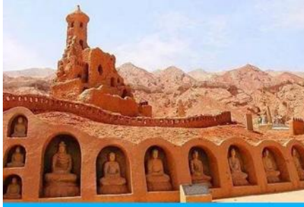
ถ้ำพระพันอวค์

ค่ำ รับประทานอาหารค่ำ ณ ภัตตาคาร พักที่ HAMPTON BY HILTON HOTEL โรงแรมระดับ 4 ดาวหรือเทียบเท่าในเมืองถู่หลู่ฟาน