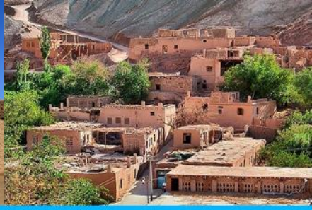
หมู่บ้านอุยกูร์