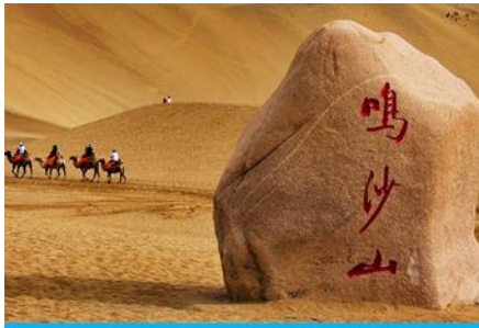
เนินทรายหมีซาซาน