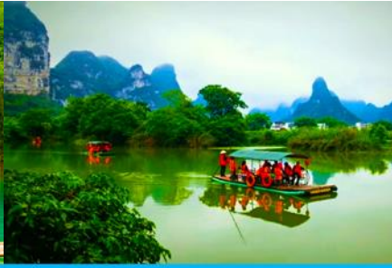
ล่องเรือชมอุทยานหมิงชื่อ