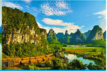
ระเบียงภาพร้อยลี่