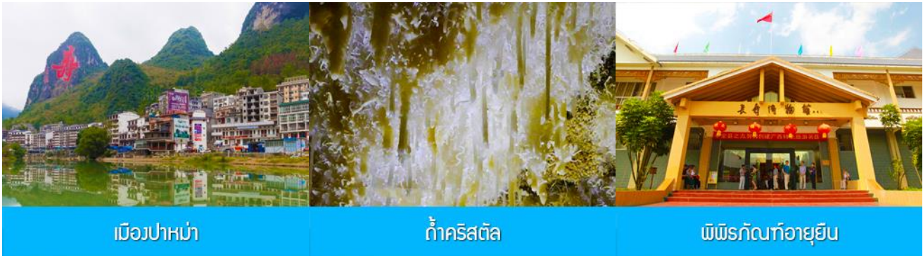
เมืองปาหม่า

พักที่ NANNING UNIVERSAL HOTEL โรงแรมระดับ 4 ดาวท้องถิ่น หรือเทียบเท่าในเมืองหนานหนิง