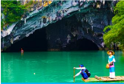
ถ้ำร้อยปีกษา