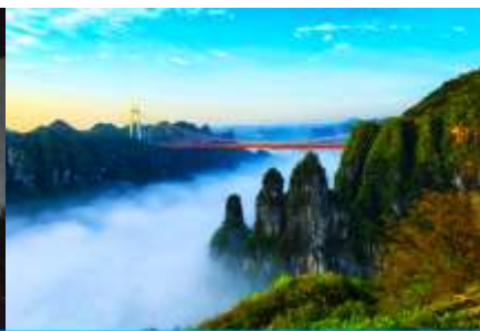
อุทยานป่าไผ่แห่งชาติไ้อ้าย