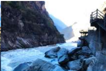
ช่องแคบเสือกระโจน