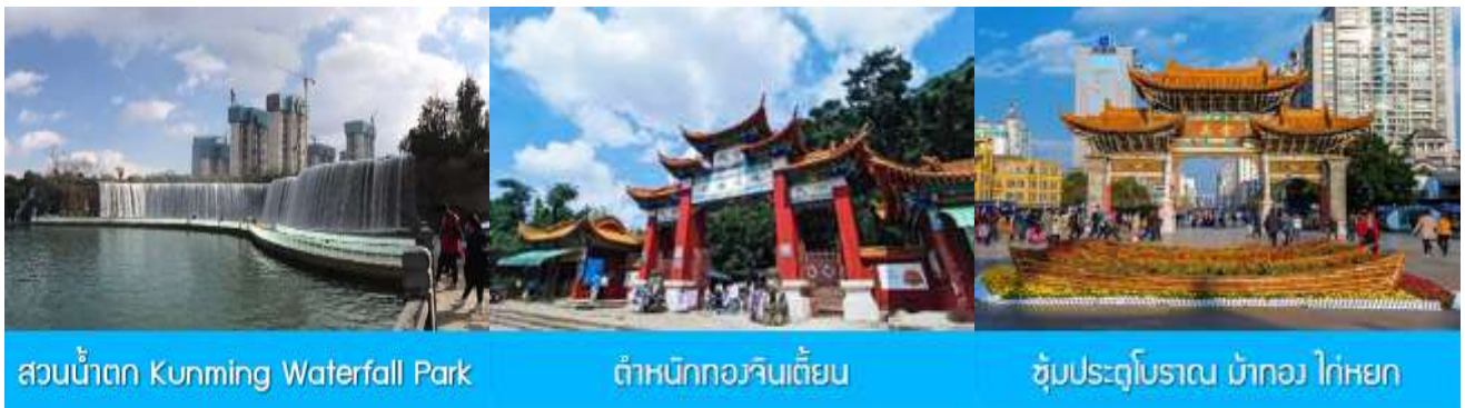
สวนน้ำตก Kunming Waterfall Park

พักที่ VIENNA HOTEL ระดับ 4 ดาว หรือเทียบเท่าในเมืองคุนหมิง