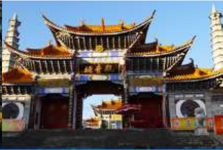
วัดเจ้าแม่กวนอิมเปลมกาย