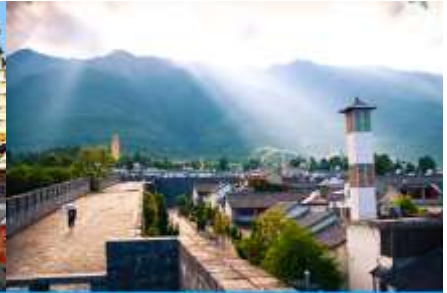
หมู่บ้านซีโจว(หมู่บ้านชาวปื)