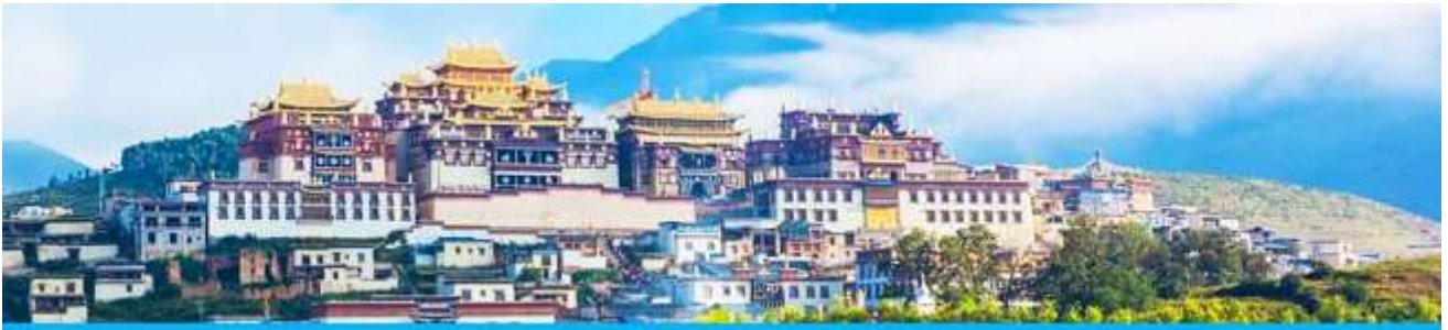
เมืองโบราณเขวงกริลา

จากนั้นนำท่านเดินทางสู่ เมืองจงดึยง โดยใช้เส้นทางด่วนวิ่งตรงเข้าเมือง จงดึยง ใช้เวลาเดินทางประมาณ 2 ชั่วโมง สู่ เมืองจงดึยง หรือดินแดนแห่งเขวงกริลา ซึ่งอยู่ทางทิศตะวันออกเฉียงเหนือของมณฑลยูนนานซึ่งมีพรมแดนติดกับอาณาเขตน่านซี ของเมืองลี่เจียง และอาณาจักรหฺยี่ ของเมืองหนิงหลง สถานที่แห่งนี้จึงได้ชื่อว่า ดินแดนแห่งความฝัน