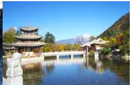
สระน้ำมังกรดำ

วันที่สาม จงดึยง-วัดลามะชวงจ้านหลิง-ช่องแคบเสือกระโจน-ลี่เจียง-สระมังกรดำ-เมืองโบราณลี่เจียง