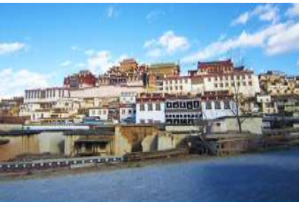
วัดลามะชวงจ้านหลิง

ที่พัก GRACE HOTEL ระดับ 4 ดาว หรือเทียบเท่าเมืองจงดึยง หรือเขวงกริลา