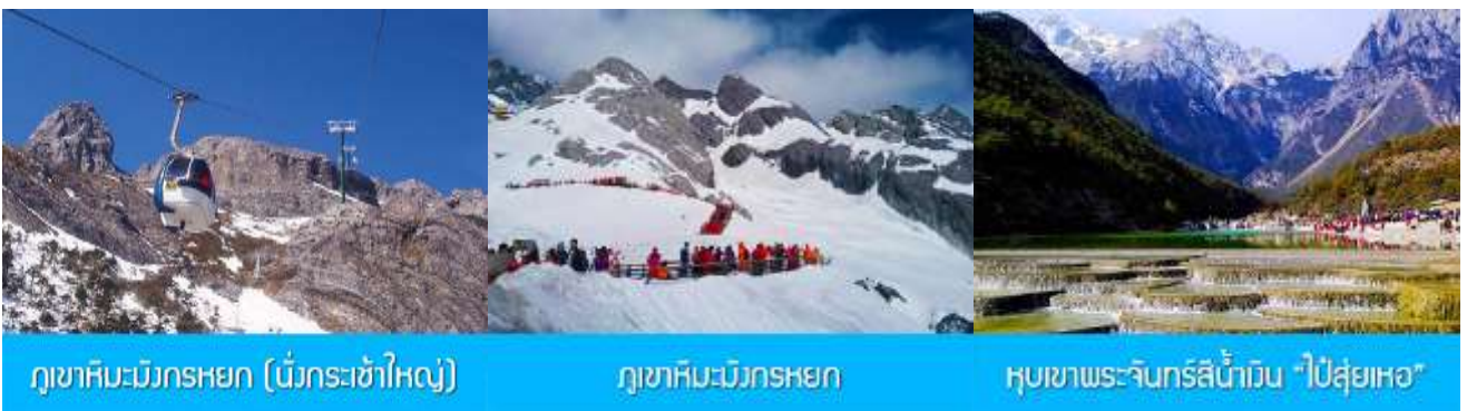
ภูเขาหิมะมังกรหยก (นั่งกระเช้าใหญ่)

ที่พัก FENG HUANG HOTEL ระดับ 4 ดาว หรือเทียบเท่าเมืองลี่เจียง