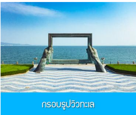
กรอบรูปวิวกทะเล

พักที่ Holiday Inn Express Hotel หรือ ระดับมาตรฐาน 4 ดาว ทั้งหมด