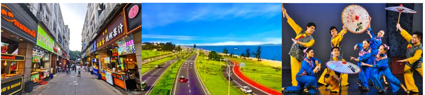
ถนนวซาลู่

พักที่ โรงแรม XIAMEN HENGLONG HOTEL 4* หรือเทียบเท่าในเมืองเซี่ยเหมิน