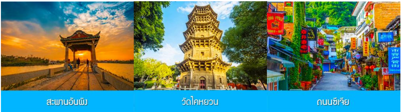
สะพานอันผิง