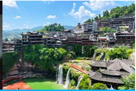
เมืองโบราณผู่หลงจิ้น

วันที่สาม เมืองจางเจียเจี๋ย-ตึกมหัศจรรย์ 72 ชั้น-พิพิธภัณฑ์ภาพหินทราย – ศูนย์แพทย์แผนจีน-เมืองโบราณผู่หลงจิ้นยามค่ำคืน