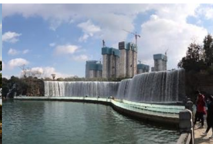
สวนน้ำตก Kunming Waterfall Park