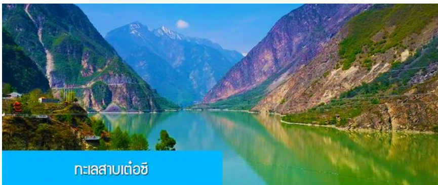
ทะเลสาบเต๋อซี

พักที่ SI GUNIANG SHAN HOTEL 4* หรือระดับ4ดาวพื้นเมือง