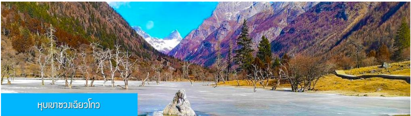
หุบเขาชวงเฉียวโกว

นำท่านเที่ยวชม หุบเขาชวงเฉียวโกว 双桥沟景区 ที่เป็นแหล่งท่องเที่ยวที่สวยงามที่สุดแห่งหนึ่งในเขตอุทยานสี่ครุณี นำท่านนั่งรถบัสของอุทยานที่วิ่งไปผ่านเส้นทางที่สร้างคู่ขนานกับลำธารภายในหุบเขา ท่านจะได้สัมผัสกับความสวยงามของทัศนียภาพธรรมชาติที่หาชมได้ยาก โดยมีภูเขาหิมะสูงตระหง่านอยู่เบื้องหลัง ธารน้ำใสไหลริน และสระน้ำที่มีสีเขียวมรกต ในฤดูใบไม้ผลิและฤดูร้อนท่านจะได้เห็นฝูงจามรีท่ามกลางทุ่งหญ้าเขียวจี ส่วนในฤดูหนาวทุ่งหญ้าและพื้นดินจะปกคลุมด้วยพรมหิมะสีขาว.. รถบัสของอุทยาน