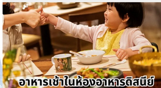
อาหารเข้าในร้านอาหารดิสนีย์