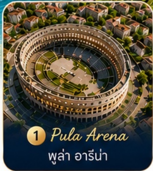
1 Pula Arena พูล่า อาร์น่า