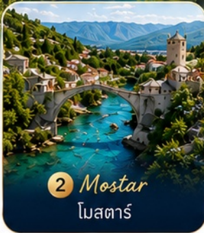
2 Mostar โมสตาร์