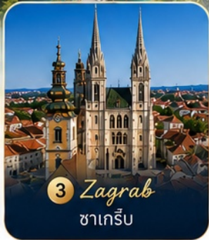
3 Zagreb ซาเกร็บ