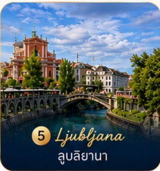
5 Ljubljana ลูบลิยานา