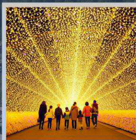
"NABANA NO SATO"