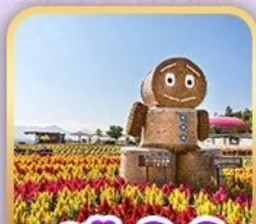
สวนซิกิไซโนะโอะกะ