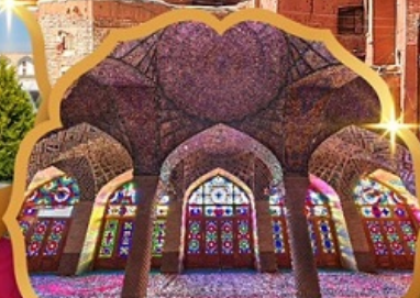
Nasir al Molk Mosque