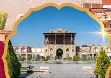
Ali Qapu Palace