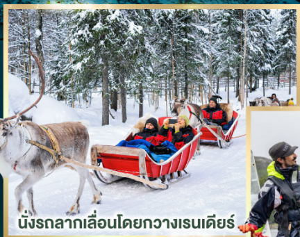
นั่งรถลากเลื่อนโดยกวางเรนเดียร์