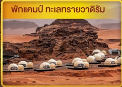
พักแรมที่ เต๊นท์ในทะเลทรายวาดีรัม