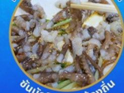
ชั้นนักชี อาหารท้องถิ่น