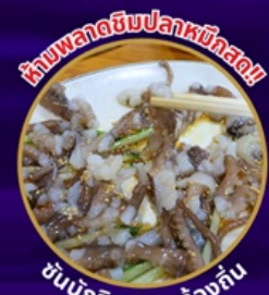
ห้ามพลาดอินปลาหมึกสด!!

ถ่ายรูปชิคๆ หมู่บ้านวัฒนธรรมคัมซอน เชคอิน คาเฟ่ริมทะเล วิวหลักล้าน ขึ้นเคเบิลคาร์ ชมทะเลปูซาน นั่งรถไฟปิ๊งปิ๊ง sky capsule ห้ามพลาด!! ตลาดปลาที่ใหญ่ที่สุด ชิมของอร่อยที่ตลาดแฮอนแด อิสระช้อปปิ้ง Lotte Duty Free