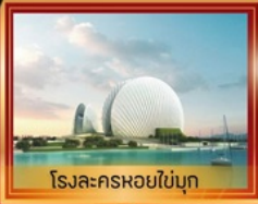
โรงละครหยอโข่มุ๊ก