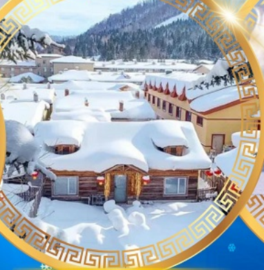
หมู่บ้านหิมะ Dream Home