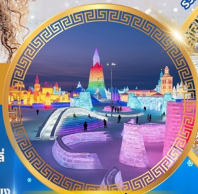
เทศกาลแกะสลักน้ำแข็ง

จตุรัสโบสถ์เซินโซเฟีย ถนนจงหยาง หมู่บ้านหิมะดินแดนมหัศจรรย์ อนุสาวรีย์ฝังหกง สนุกสนานกับลานสกียาปูลี ถนนแฉ่ยู่เจีย เขาแกะหญา เขาป่าจูลู ภาพเขียน Ice and Snow แม่น้ำซงฮัวเจียง โซ่วว้ายน้ำแข็ง เกาะพระอาทิตย์