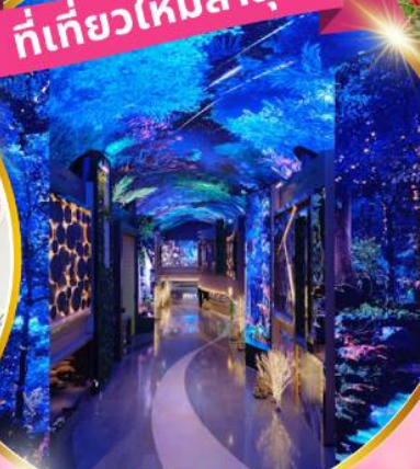
INSPIRE Entertainment Resort