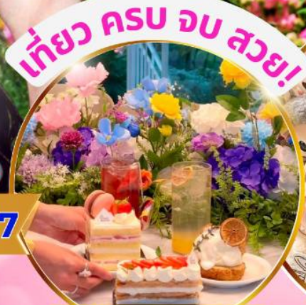
คาเฟ่ดัง Forest Outing