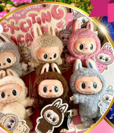
Pop Mart สงแด