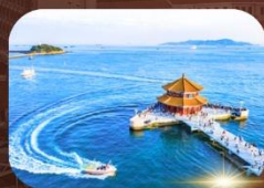
สะพานจันเฉียว