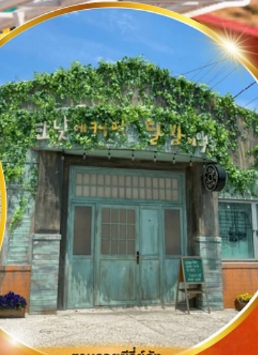
ตามรอยซีรีส์ดัง Hometown chachacha