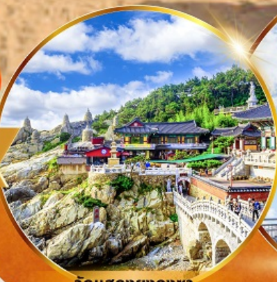
วัดแฮดงยงกุงซา