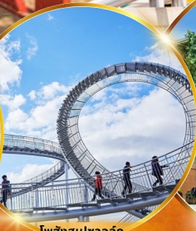
โพฮังสเปซวอล์ค