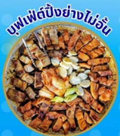
บุฟเฟ่ต์ช้อปปิ้งไม่อั้น