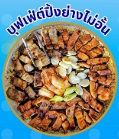
บุฟเฟ่ต์อย่างไม่อื่น