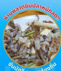
ห้ามพลาดชิมปลาหมึกสด!! ซันนิกอิ อาหารท้องถิ่น

ถ่ายรูปชิคๆ หมู่บ้านวัฒนธรรมคิมซอน ใหม่ล่าสุด คาเฟ่ริมทะเล วิวหลักล้าน ซินเคเบิลคาร์ ชมทะเลปูซาน ห้ามพลาด!! ตลาดปลาที่ใหญ่ที่สุด ชิมของอร่อยที่ตลาดแฮจุนแด ช้อปปิ้งตลาดพื้นเมือง แหล่งช้อปปิ้งใต้ดิน ซัมซอน อิสระช้อปปิ้ง Lotte Duty Free