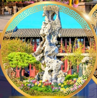
สวนหลิวหยวน

ถนนหนทางจิ้งจู้ หาดไว่ทาน ชมหอไข่มุก ล่องเรือทะเลสาบซีหู ตำนานพญางูขาว เจดีย์เหลเย่เฟิง ถนนเลี้ยวเหอจื่อเจีย วัดหลงหยวน สวนหลิวหยวน ซุปป์ิง ถนนกวนเจี้ยนเจีย ถนนซีหลี่ซานถึง วัดพระหยก เซคอินย่านเก่าซิ่นเทียนตี้ สักการะศาลเจ้าพ่อหลี่ก๊กเมือง