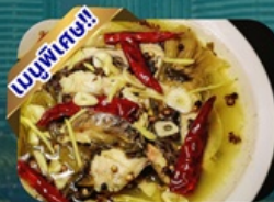
ปลาต้มผักกาดดอง