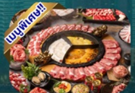
ซูฟเฟ้ดชาบู