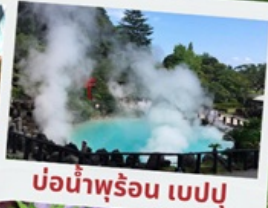
บ่อน้ำพุร้อน เปรปุ

หมู่บ้านยูฟูอินฟลอร์ริล ทะเลสาบคินริน ทะเลสาปคินริน บ่อน้ำพุร้อน อุมิจิโกกุ ท่าเรือโมจิโกะ เรโร ตลาดปลาคาราโตะ ศาลเจ้ามียาจิดาเกะ ดิวตี้ฟรี ฟุกุโอกะ เบย์ พลาซ่า ช้อปปิ้งออน มอลล์ หิ้งคูเมโอโตะอิวะ ชมดอกไม้ไฮเดรนเยีย รอนน้ำตกชิราอิโตะ ช้อปปิ้งย่านเท็นจิน