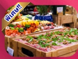
Buffet Dinner Banahill