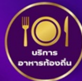
บริการ อาหารท้องถิ่น