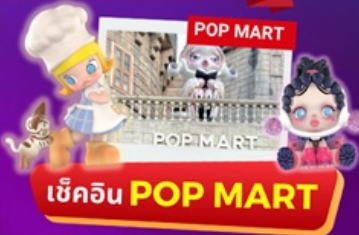
เข้คิน POP MART