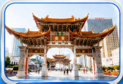
ประตูม้าทองไถ่หยก