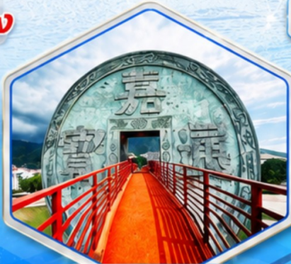
จตุรัสเหรียญโบราณ