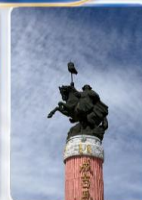
สวนสุสานเจงกิสข่าน (ชมด้านนอก)