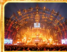
สถานที่จัดงาน เทศกาลเบียร์ชิงเต่า