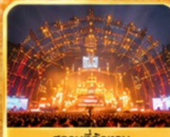
สถานที่จัดงาน เทศกาลเบียร์ชิงเต่า