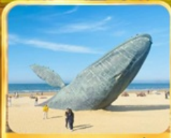
ประมาติกรรมวาฬเกยตื้น