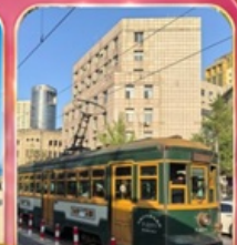
ขั้รถรางไฟฟ้าชมเมือง