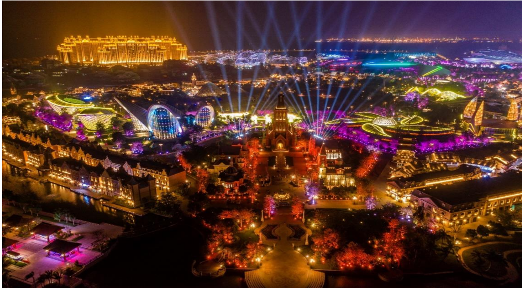
ที่พัก Fu'an Tailong Sea-view hotel 4ดาว หรือเทียบเท่า4ดาวจีน