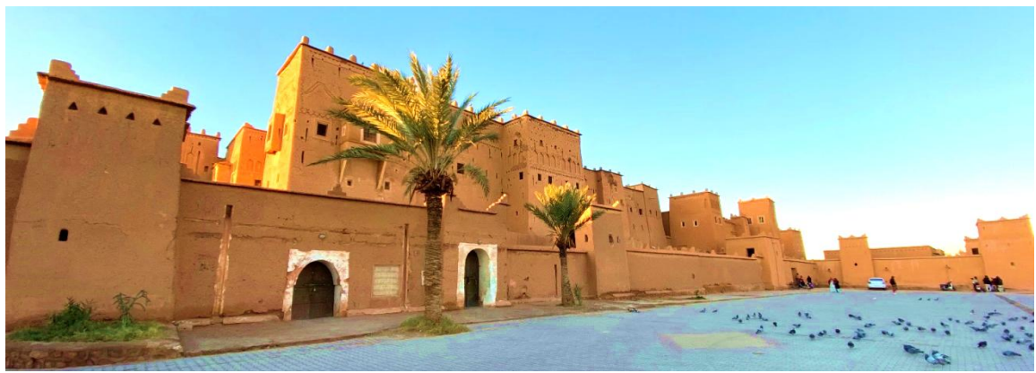
พักผ่อนค้างคืนในเมืองวอซาเซท Oscar Hotel 4* , Ourrzazate หรือเทียบเท่า

7) วันที่เจ็ด วอซาเซท - ไอท์ เบน ฮาดดู - มาราเกช (B,L,D)