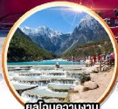
อลังการความงาม