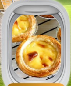
การ์ทไส่