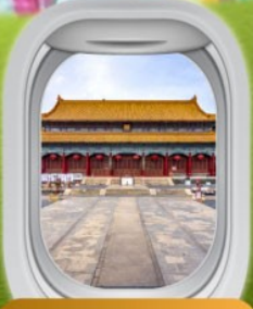
พระราชวังหยวนหมิง