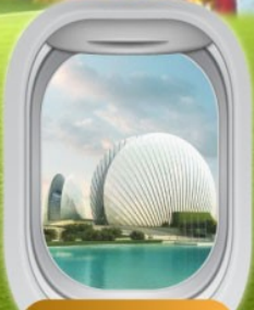
โรงละครโอเปร่า