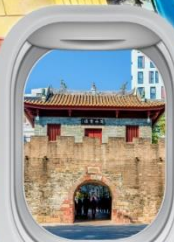
เมืองโบราณหนาวโกว