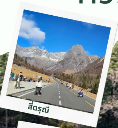
สี่ดรุณี