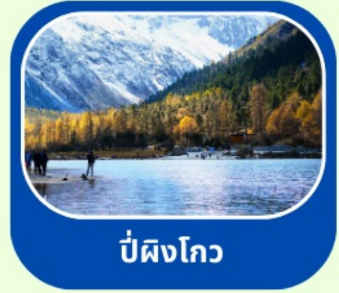
ป่ผิงโกว